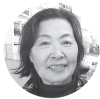
いまざと診療所 初代看護師長