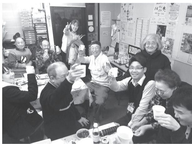
ワンコイン忘年会

た。「大阪を歩こう」「映画会」、年1回ですが「文楽鑑賞」も行われています。利用される人々がマスコットのまねきねこに入れてくださるワンコイン（100円）が運営を助けています。困りことや相談事を持ち込まれたら職員と力をあわせて解決を図り、困難な事例については専門家を紹介するなどして喜ばれています。他団体にも利用（有料）され、地域の交流の場となっています。顔を合わせ話し合っ医療生協のモットー「元気で長生き」を目指しましょう。